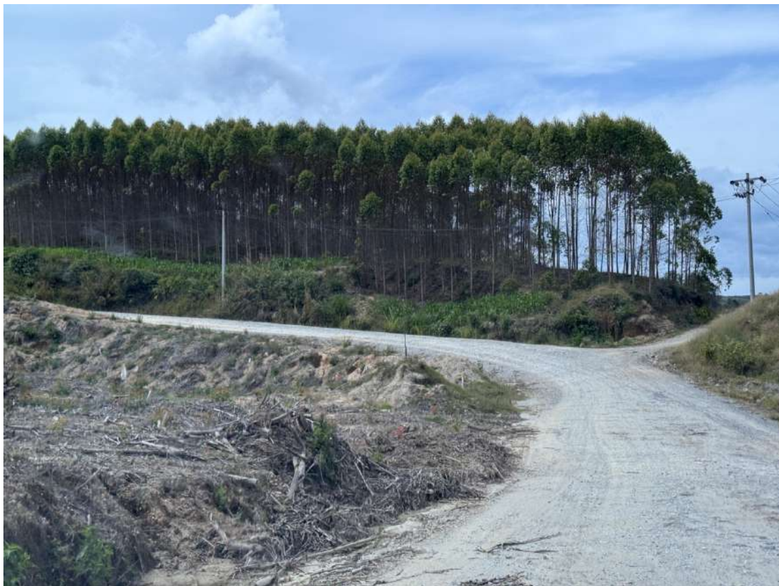
“一面に広がるユーカリ植林地”