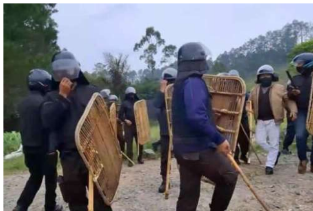
住民が撮影した暴力事件が起きたときの様子 (Environmental Paper Network より)

的な暴力を受け、住民の一人が首に全治三週間の怪我を負った。また、住民たちが所有する22台のバイクと3台の車が破壊された。この事件から一週間ほどは、住民たちは外に出ることを恐れ、一つの家を集まって皆で一緒に過ごした。企業により外部からのアクセスも完全に封鎖され、支援に来た教会組織のメンバーがアクセスを拒否された。この事件が起きた後、企業側は住民たちによる器物破損と暴力事件として警察に通報した。それに対し、住民たちをサポートする NGO は企業による器物破損、窃盗（売店のタバコが盗まれていたため）、暴力事件として詳細な情報とともに警察に通報した。2026年2月現在に至っても警察による捜査は続いている。