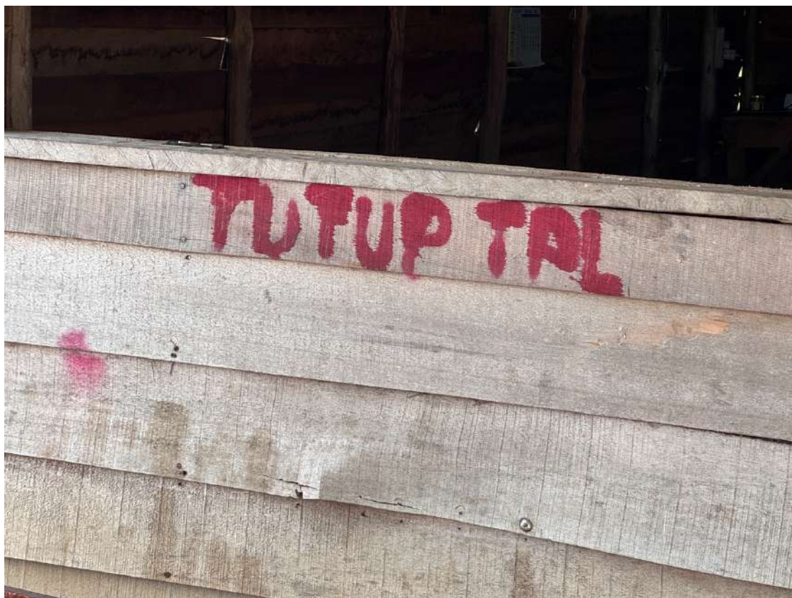
ドロック・バルモナンガン集落の集会場に書かれた“TPL 社を閉鎖せよ”の文字