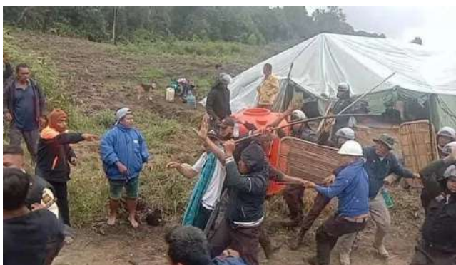
警備員からの暴行を受ける住民たちの様子

たユーカリを収穫させて欲しいと企業から話を持ちかけられた。住民側は、いま植えられているユーカリの収穫のみで、それ以降の再植林はしないという条件のもと許可したが、2025年2月、企業はこの合意を破って再び植林を始めた。先住民族のリーダーによれば、この契約は正式な書類を交わしたのではなく、単なる口約束に過ぎなかった。教会という神聖な場所で約束が交わされたことや、企業の上層部も参加していたことから、皆が企業を信じていたという。住民たちが現場に詰めかけて対話を求めたところ、企業側は話し合いに応じるどころか警備員をけしかけて住民たちに一方的に暴行を加えた。この事件の後、住民たちは約一ヶ月にわたり安息香のある慣習林へのアクセスを制限された。