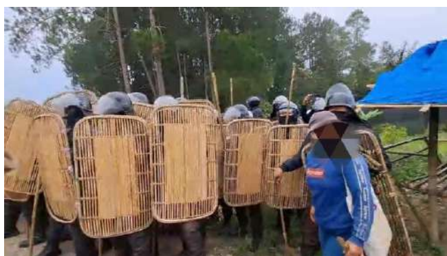
2025 年 9 月 23 日に起きた暴力事件の様子。住民と対峙する企業の治安部隊

また、2025 年 9 月 23 日には企業による過去最大の暴力事件が発生した。その日の朝、住民たちは共同作業 (gotong royong) を行っていた。そこに装備を身につけた警備員数十人が現れたため、住民たちは一目散に逃げた。逃げ惑う住民たちに対して、警備員たちは女性や子ども、障がい者を問わず殴りかかり、少なくとも 33 人が負傷した。警備員が立ち去った後、住民たちが現場に戻ると、住民たちが所有するバイク 10 台とピックアップトラック 1 台が燃やされ、重機で埋められて証拠隠滅が図られていた。また、コーヒー農園が破壊され、収穫したショウガ約 20 トンが消失するなどの被害を受けた。その後、しばらくは農作物を収穫することが許されず、警察に許可を得なければならない状況が続いた。