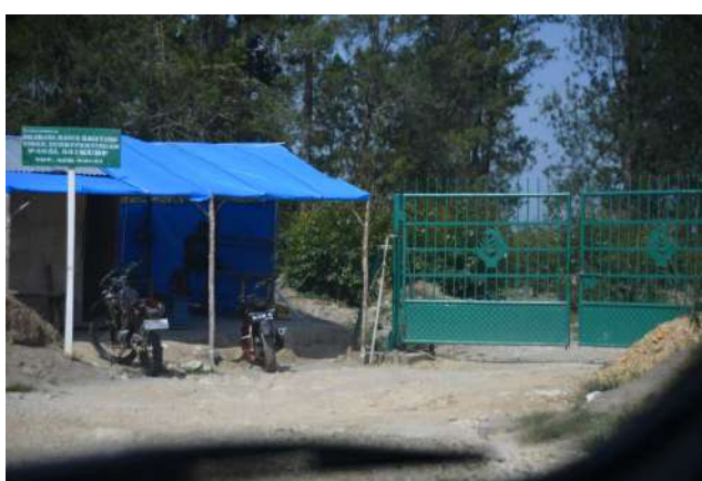
企業が設置したゲート、「関係者以外立ち入り禁止」の看板も。

ドロック・パルモナガン集落の面積は 850 ヘクタール、このうち企業の土地と重複しているのは 250 ヘクタールである。企業はポンドック・ブルック村の存在は認識しているものの、唯一、ドロック・パルモナガン集落の存在だけは認識していないという。住民たちの話では、企業の事業許可地域を示す地図にもこの集落は存在しないという。そのため、ポンドック・ブルック村を構成する他の 4 つの集落にドロック・パルモナガン集落の存在を証明してもらう文書を作成し、この文書にもとづき企業の事業地を変更してもらうよう政府に働きかけているが、現在までに実現していない。2019 年には、当時の環境林業大臣であるシティ・ヌルバヤ氏が現地に訪問し、土地紛争の解決に向けて慣習地登録協会 (BRWA) に登録するよう住民たちに提案した。その後、環境林業省から、先住民族に法的なステータスを与える枠組みである「村落林 (Hutan Desa)」に申請するよう勧められた。村落林への申請の最初のプロセスとして、県政府から先住民族としての存在を認識してもらい、推薦状を発行してもらう必要がある。しかし、慣習地登録協会 (BRWA) から慣習地の認定を受けていたにもかかわらず、現在までに県政府からの推薦状を得ることはできていない。