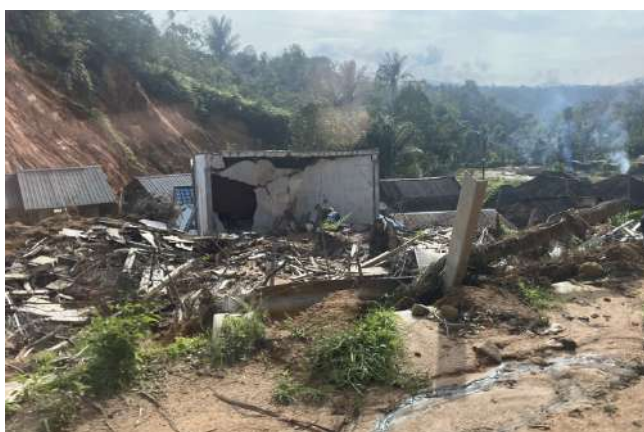
大規模な土砂災害の爪痕、災害から三ヶ月を経てもなお孤立している村もあるという。

2025年11月下旬から12月上旬にかけて、スマトラ北部を中心に記録的な豪雨にともなう洪水と土砂災害が発生した。2025年12月26日現在で、死者は少なくとも1,100人を超え、避難者は100万人、またこの災害による経済損失は、68.7兆ルピア（約6,400億円）に達したとされる。スマトラ島での洪水に関連する経済的損失は日本円にしておよそ6,400億円を超えると推定され、独立後のインド