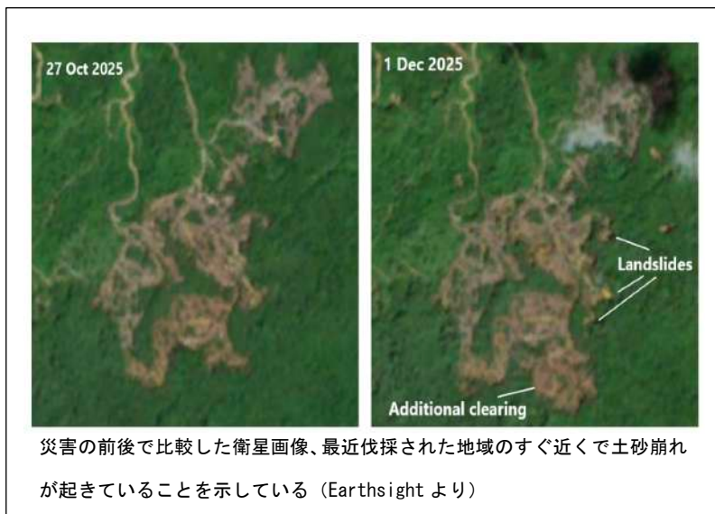
災害の前後で比較した衛星画像、最近伐採された地域のすぐ近くで土砂崩れが起きていることを示している

この地域での伐採は、洪水が発生する直前まで続けられた。以下の衛星画像は、土砂災害が起きる直前である 2025 年 10 月 27 日と直後の 12 月 1 日の様子を比較したものであるが、土砂崩れが直前に伐採された地域のすぐ近くで発生したことを示している。