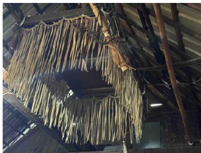
先住民族であるパタック伝統の家屋にある神棚。お供え物とともに伝統的な楽器を使って神を讃える儀式に使われる。

シハポラス村は、北スマトラ州シマルングン県ペマタン・シダマニク郡に位置する。この村の先住民族グループは「ラムトラス (Lamtoras)」と呼ばれ、インドネシア独立の前からこの地で暮らしてきた。ラムトラスの歴史は 1800 年までさかのぼり、先祖はもともとトバ湖に浮かぶサモシール (Samosir) 島で生活していたが、コミュニティ内部で対立が生じたため、島の外へ移住したと言われている。先祖がこの地に移り住んできてから、現在の住民は 11~12 世代目にあたる。いまなお「パンダヨガン (pandayogang)」と呼ばれる 7 つの伝統的な儀式が、住民たちにより引き継がれている。