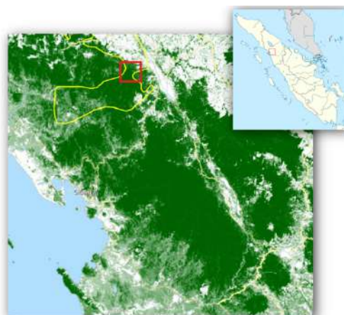
Aek Raja 地域、黄色が TPL 社のコンセッション地域の境界を示す

環境大臣であるハニフ・ファイソル・ヌロフィク氏は、タバヌリ地域で発生した土砂崩れや洪水に関与した可能性のある8社の活動の証拠を掴んでいると発表した 12 。さらに、12月6日、森林省の法執行総局は、最近の災害による被害の一因となった可