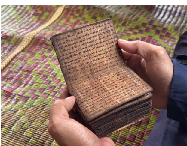
村の歴史について書かれた文書、独自の象形文字で書かれている。

ナティンギル集落は、トバ (Toba) 県、シマレ (Simare) 村に位置する。この集落では 350 年ほどの歴史があり、現在の住民は 14~18 世代目にあたる。独自の文字を持っており、村の歴史について書かれた本が残されている。いつ書かれたものであるかは不明だが、17 世紀初頭にオランダ統治時代が始まったときにこれらの文字は廃止されたことから、それ以前から独自の文化があったことを示す証拠となっている。