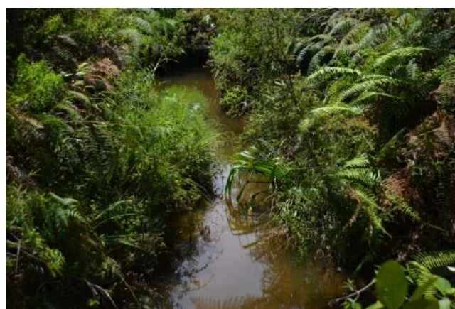
企業の操業により汚染されてしまった川

住民たちからの度重なる働きかけに対し、県政府からお米や支援金など短期的な援助が行われたただであった。聞き取りを行ったある住民は、「わたしたちは政府にお金や食糧を求めている訳ではない、ただ昔から使ってきた土地を使わせて欲しいだけなのだ。」と言う。今後、住民たちは州や中央政府にも県政府に対応してもらえよう働きかけをしていきたいと考えている。