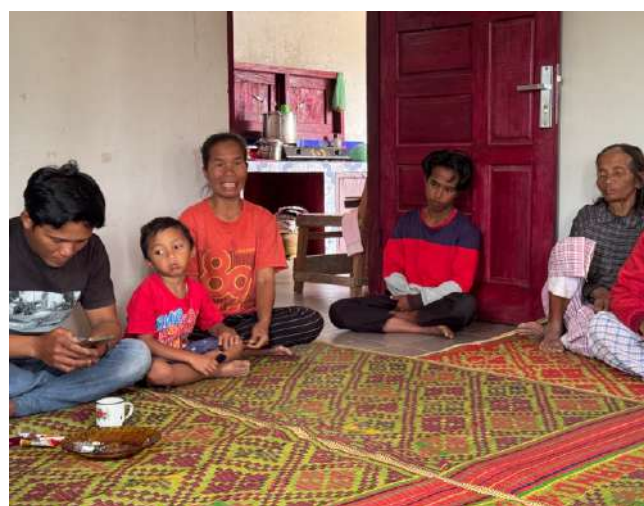
住民たちへの聞き取りの様子。

2015 年頃から企業との土地をめぐる紛争が深刻になったという。住民たちは自分たちの土地に対する権利を認めてもらうため、ジャカルタで環境林業省や国家人権委員会 (KomnasHAM) などを訪問した。当時、同じバタック民族の国会議員が、問題解決のために国会で質問をするなど尽力してくれたが、現在までに結果は出ていない。2021 年には、県政府と中央政府による現場検証が行われたが、慣習コミュニティの存在や慣習地の認知はいまだに認められていない状況である。環境林業省は、住民たちに対して企業とのパートナーシップを提案した。これは、5,000 万ルピア (約 45 万円) の資金援助により指定された地域で農業をするものであったが、森林地域内ではなく企業のコンセッション地域ではない他用途地域 (APL) が対象とするものであった。しかし、実際には農業には適さない急峻な土地であり、このプログラムに参加することで企業による新たな土地収奪の機会を与える可能性を恐れ、住民たちはこの提案を拒否した。